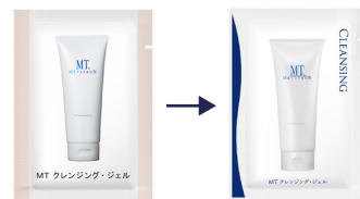
パッケージデザインをリニューアルしました