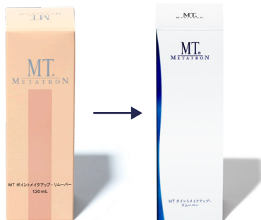
パッケージデザインをリニューアルしました