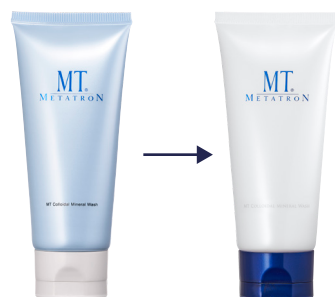
パッケージデザインをリニューアルしました