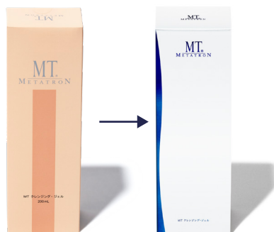
パッケージデザインをリニューアルしました