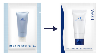
パッケージデザインをリニューアルしました