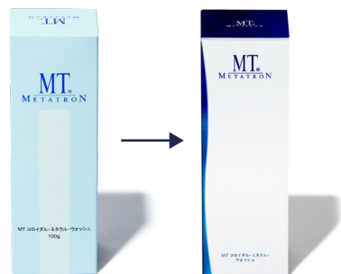
パッケージデザインをリニューアルしました