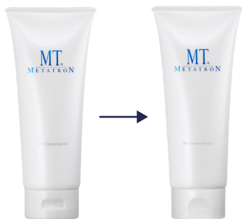
キャップに水が溜まりずらい仕様に変更しました